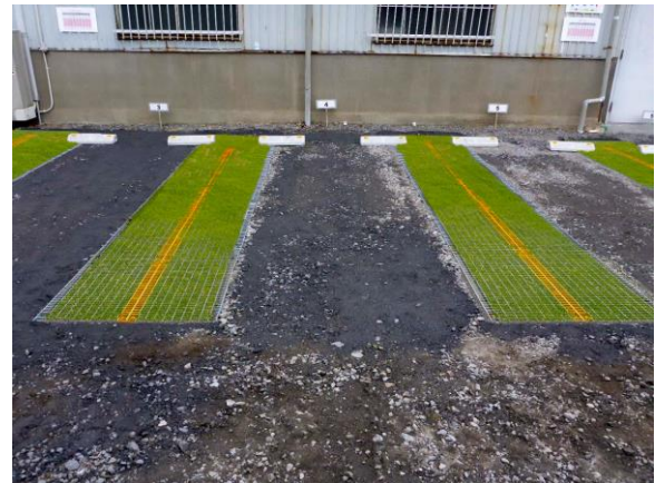
「とまるtoみどり」(とまとみどり)施工写真